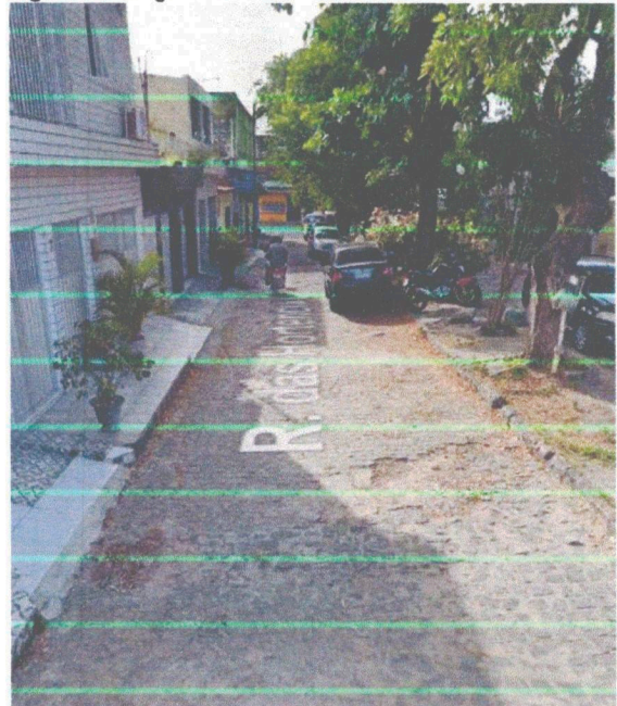
Figura 1: Imagem da Rua das Hortências