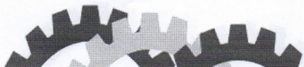
YVES RIBEIRO DE ALBUQUERQUE Prefeito

Gabinete do Prefeito, 21 de setembro de 2023.