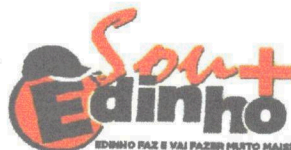
Edinho Vereador Presidente

APROVADO 08/03/22 Diretor Legislativo HU